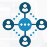
Группы ведения НСИ